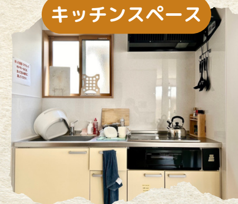
材料持ち込みでお料理可